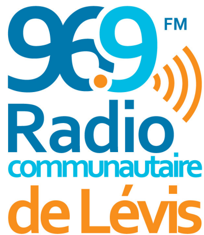
Structure des revenus d'une radio communautaire