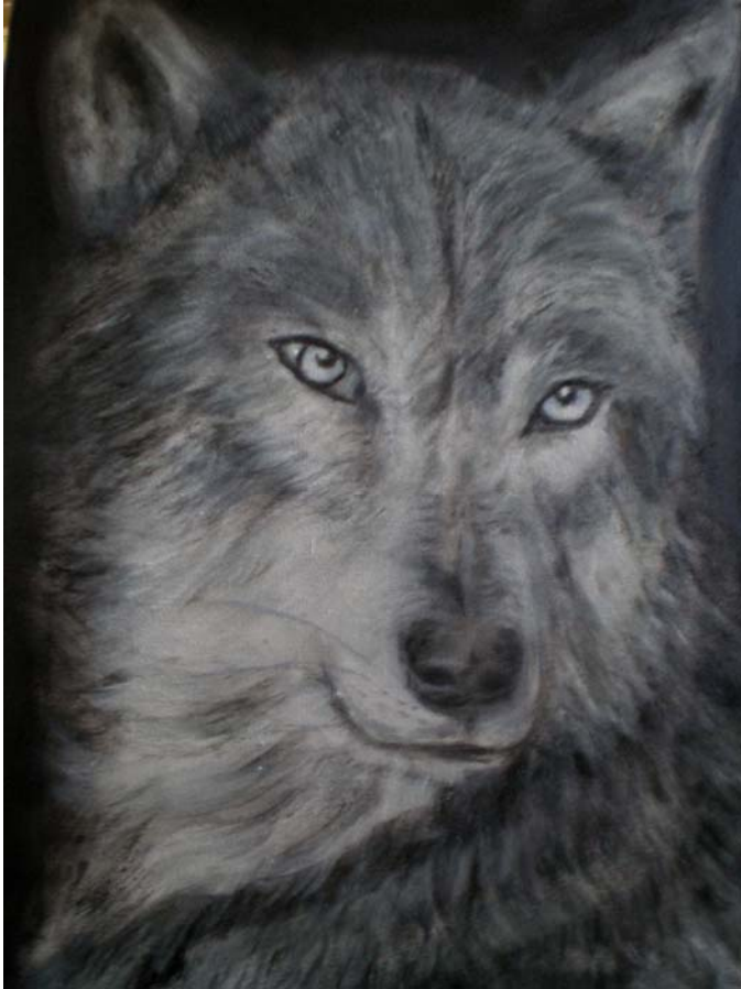
Illustration de Françoise Bardin Borg