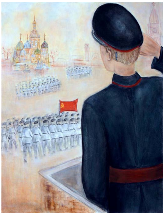
Illustration de Françoise Bardin Borg