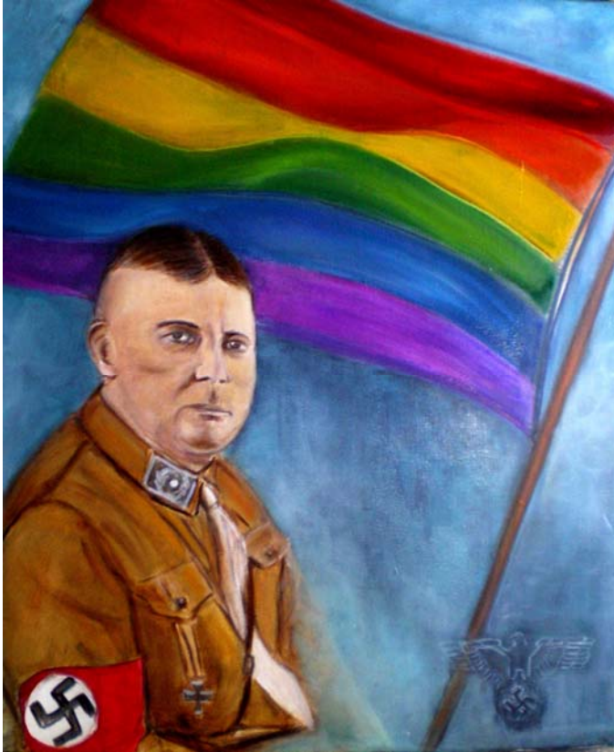
Illustration de Françoise Bardin Borg